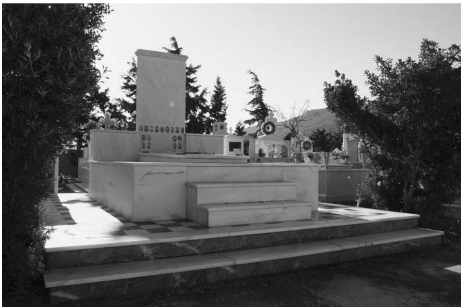
Εικ. 2. Ομαδικός τάφος 17 βοσκών στα Λεγραινά