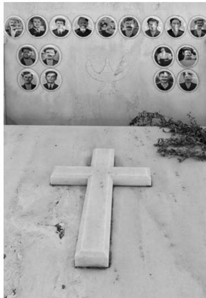
Εικ. 1. Ομαδικός τάφος 17 βοσκών στα Λεγραινά