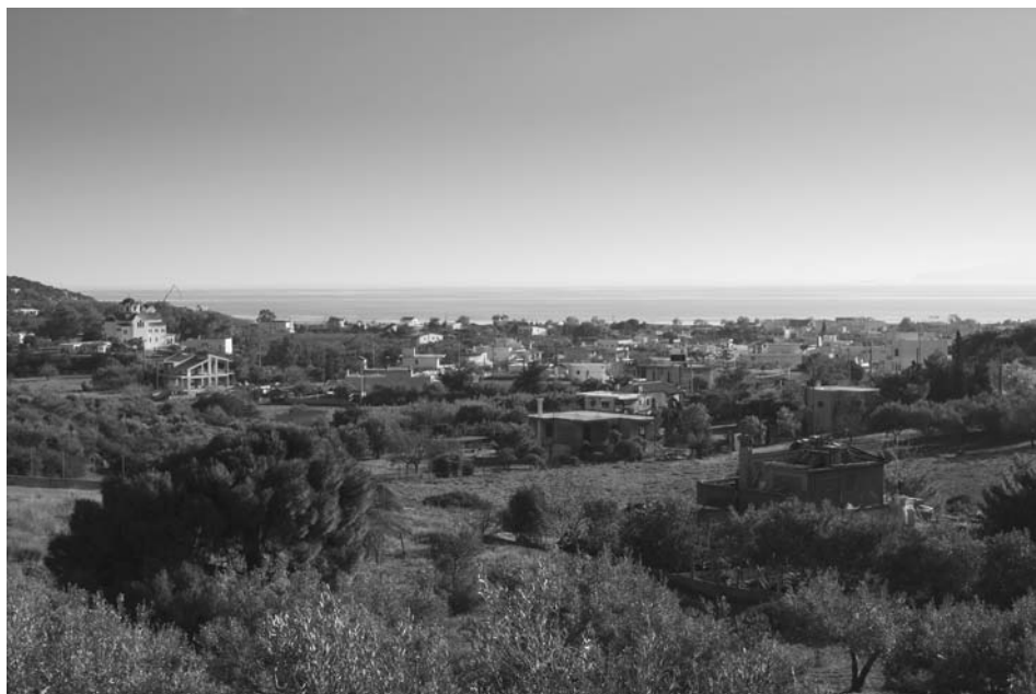
Εικ. 4. Άποψη Λεγραινών