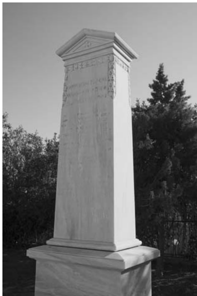
Εικ. 3. Ηρώον στην πλατεία Λεγραινών