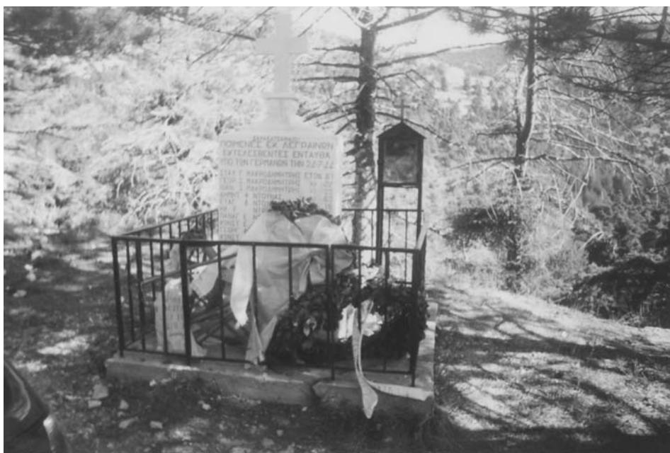
Εικ. 6. Μνημείο των 17 βοσκών από τα Λεγγραϊνά στην Πάρνηθα