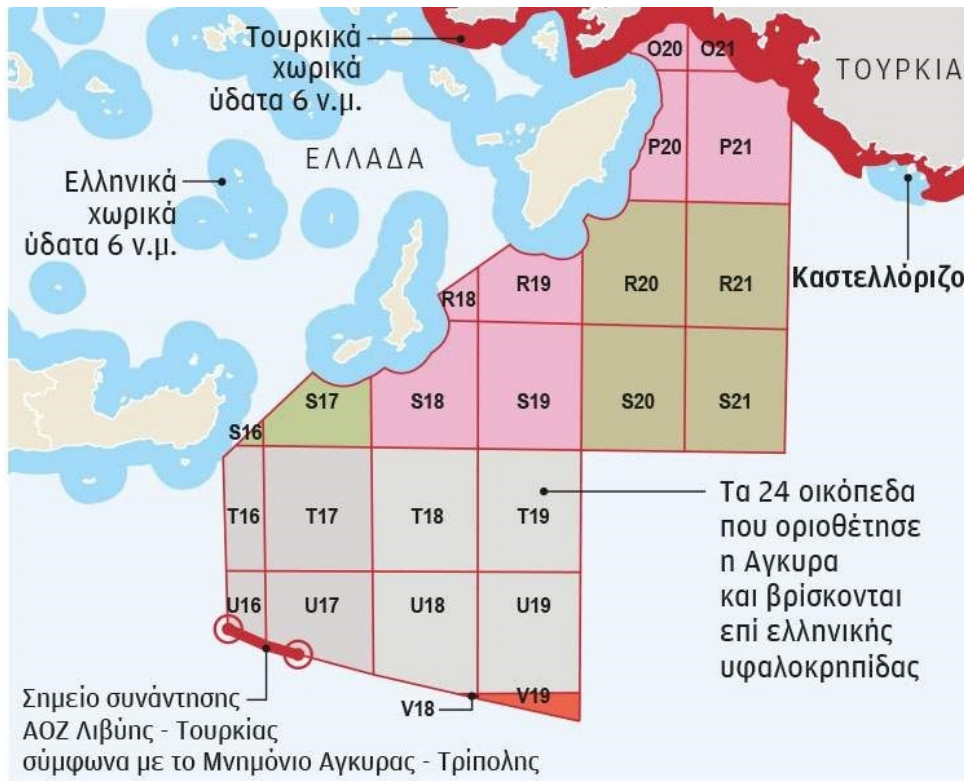
Εικόνα Β, πηγή: @CERCIYES, MFATurkey, 2 Ιουνίου 2020,